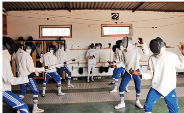
Séance d'escrime, animée par une surveillante pénitentiaire, F.Sy.